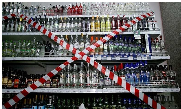
постановил изъять у ООО «Тамерлан» 900 бутылок водки