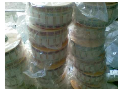
Арестованные федеральные специальные марки производства ООО «Каскад»