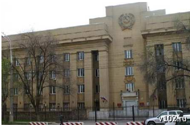
Краснооктябрьский районный суд г. Волгограда

Судья Краснооктябрьского районного суда г. Волгограда И.И.Костюк постановлением от 7 февраля 2011 г. по делу № 5-21/11 постановил алкогольную продукцию в количестве 900 бутылок производства ООО «Каскад» изъять у ООО «Тамерлан» и направить на переработку или уничтожение.