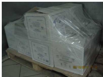
Арестованная алкогольная продукция производства ООО «Каскад»